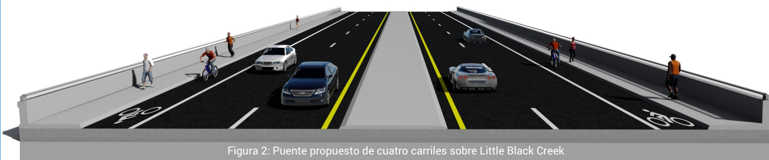
Figura 2: Puente propuesto de cuatro carriles sobre Little Black Creek

El proyecto propuesto ampliaría el puente en CR 220 sobre Little Black Creek (vea Figura 2). También se proporcionarán aceras y carriles para ciclistas en el puente.