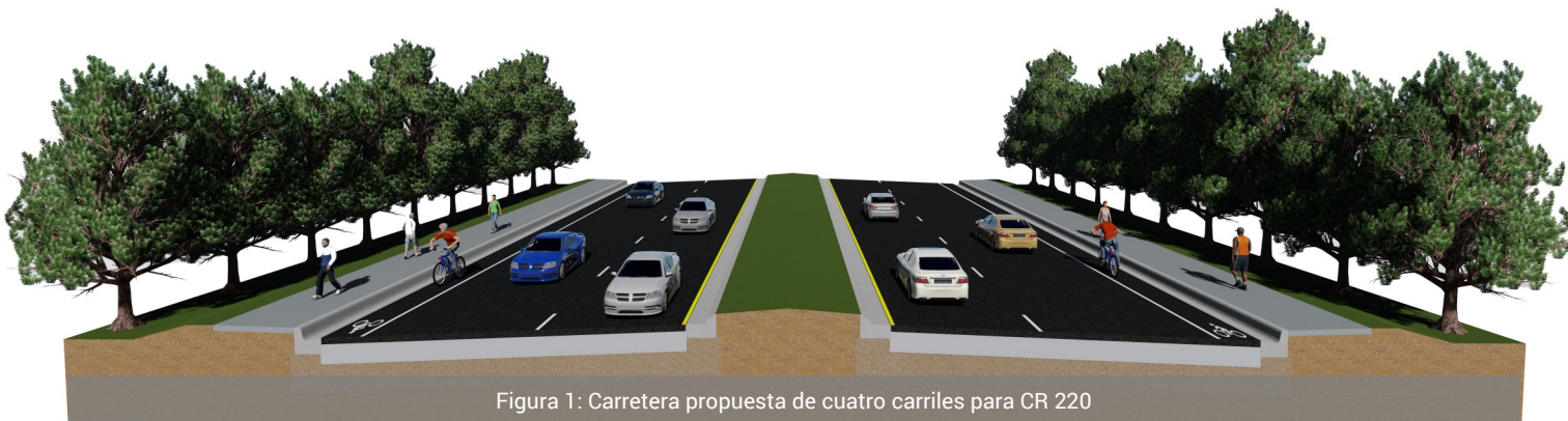
Figura 1: Carretera propuesta de cuatro carriles para CR 220

El proyecto propuesto ampliaría CR 220 a una carretera dividida de cuatro carriles (vea Figura 1). Las mejoras propuestas añadirán aceras y carriles para ciclistas al CR 220.